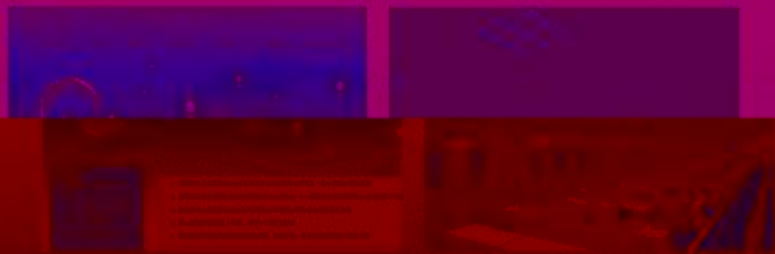
图 5-1-1 工程实践创新项目